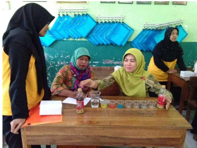
Gambar 1. Kegiatan Perancangan Media Belajar Sains Berbasis Ramah Lingkungan

Pada tahap perancangan, guru SD/MI melakukan perancangan dan pembuatan media belajar sains berbasis ramah lingkungan. Guru SD/MI dibagi menjadi 5 kelompok dengan masing-masing tiap kelompok sebanyak 4 guru SD/MI. Tiap kelompok membuat media belajar sains berbasis ramah lingkungan sesuai prosedur yang diberikan oleh narasumber/instruktur. Media belajar sains berbasis ramah lingkungan yang dibuat ada beberapa topik yaitu media pencampuran warna, media benda tenggelam, melayang, dan terapung, media sistem pernapasan, dan media energi angin. Pada kegiatan ini, beberapa guru kesulitan dalam membuat media belajar sains dikarenakan memang dalam pembuatan media ada yang menggunakan alat gunting dan cutter untuk melubangi atau memotong botol plastik terlebih kelompok yang hanya perempuan saja. Hal ini menjadi penghambat sementara dalam menyelesaikan pembuatan media belajar sains berbasis ramah lingkungan. Namun secara menyeluruh, guru SD/MI peserta pelatihan sangat antusias dalam membuat dan mendesain media belajar sains berbasis ramah lingkungan sebaik mungkin (Gambar 1).