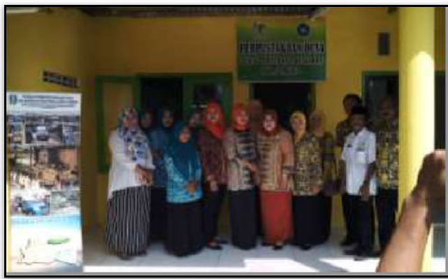
Gambar 13. Kunjungan Bunda Baca Kabupaten Jombang