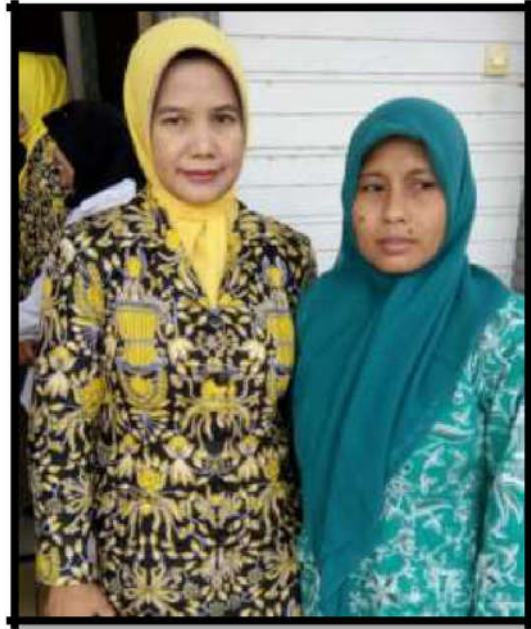
Gambar 10. Ekspansi kerjasama dengan Kecamatan Kesamben

Dengan advokasi dengan beberapa pihak luar baik instansi Pemerintah maupun swasta diharapkan ada bentuk kerjasama dalam beberapa kegiatan yang akan dilaksanakan oleh perpustakaan desa. Kegiatan-kegiatan dimaksud adalah dengan mengajak instansi-instansi yang ada untuk bersama-sama melaksanakan kegiatan penyuluhan, sosialisasi dan pelatihan.