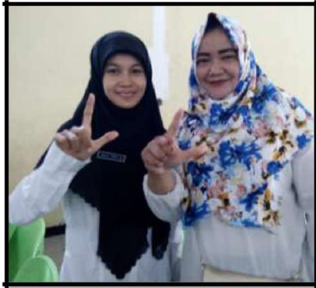
Gambar 8. Ekspansi kerjasama dengan Puskesmas Kesamben

instansi pemerintahan maupun swasta diantaranya adalah dengan Puskesmas Kesamben, Polsek Kesamben, Kecamatan Kesamben, Perpusda Jombang, Pondok Motivasi Jombang, dan BUMDesa “Podo Joyo” Podoroto.