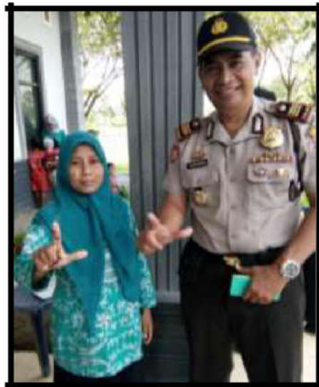
Gambar 9. Ekspansi kerjasama dengan Polsek Kesamben