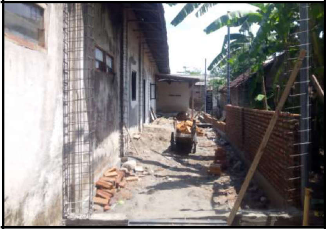
Gambar 10. Proses pembangunan gedung baru perpustakaan desa Podoroto