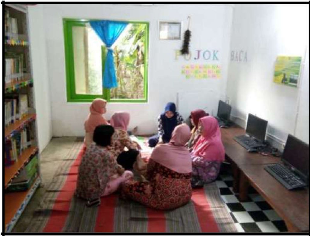
Gambar 4. Ruang Perpustakaan desa sesudah relokasi