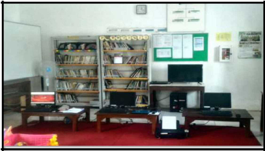
Gambar 8. Fasilitas Perpusdes