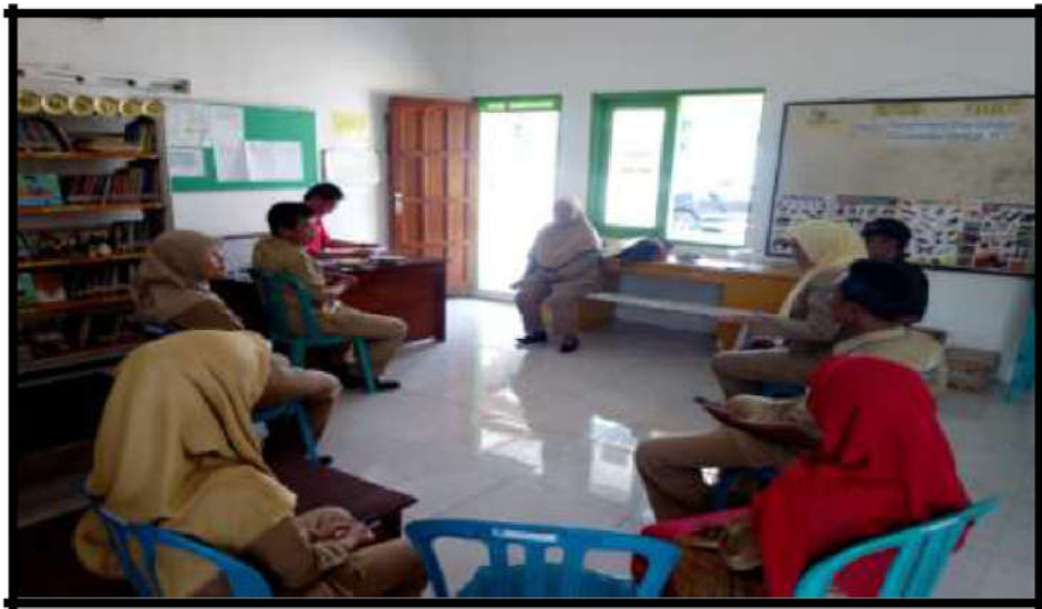
Gambar15. Foto Kunjungan Tim Perpuseru beserta Kepala Perpustakaan Daerah (Mastrip) Jombang

Program ini memberikan pendampingan kepada perpustakaan kabupaten/kota untuk melakukan pelatihan dan mentoring ke perpustakaan tingkat desa terkait advokasi, peningkatkan akses dan penggunaan layanan komputer dan internet dan fasilitasi kebutuhan masyarakat yang terlibat.