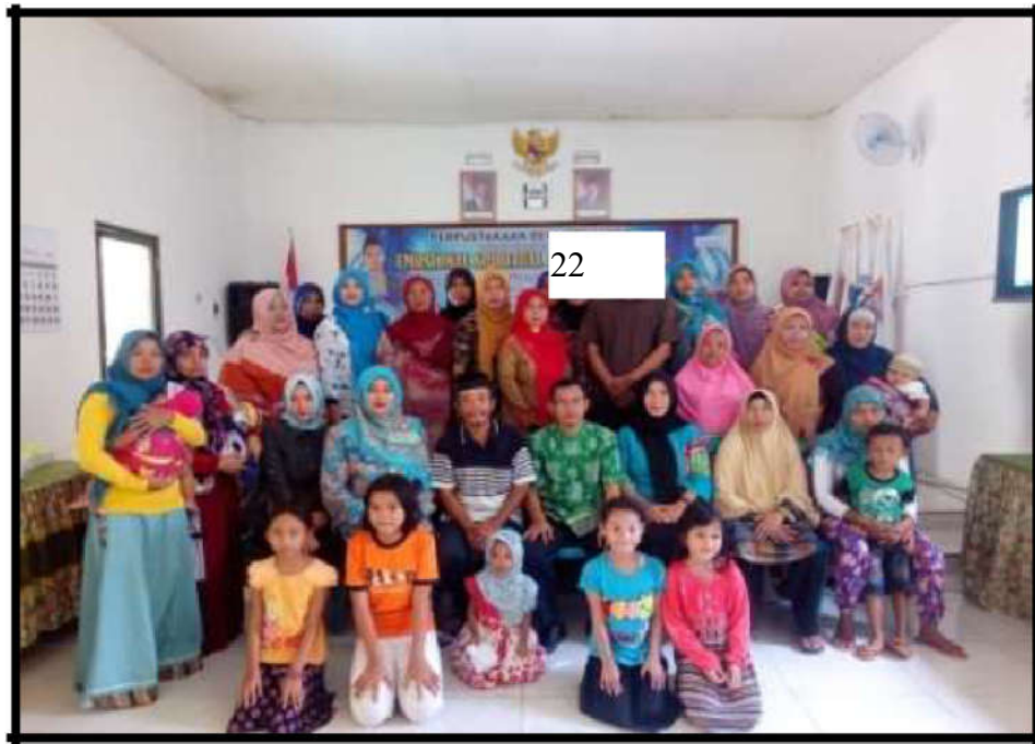
Gambar 19. Kegiatan Hipnoparenting bersama Pondok Motivasi dan Hipnoterapi Jombang

Kegiatan Taman Posyandu Harapan Bunda yang merupakan hasil dari kerjasama TP PKK desa Podoroto dengan perpustakaan desa Podoroto, melalui kegiatan ini terlaksana tiga kegiatan sekaligus, yakni kelas PAUD, kelas BKB dan Posyandu Balita