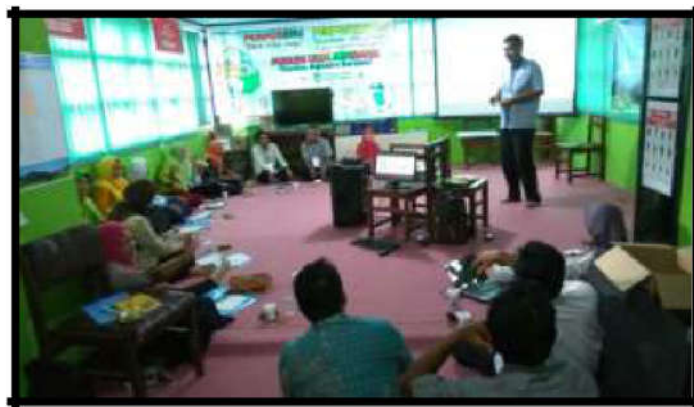
Gambar 11. Kegiatan Diklat di Perpustakaan Kabupaten Jombang