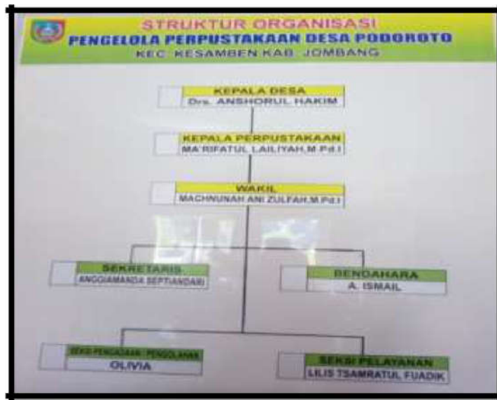
Gambar 1. Struktur Organisasi Pengelola Perpustakaan Desa Podoroto 2017