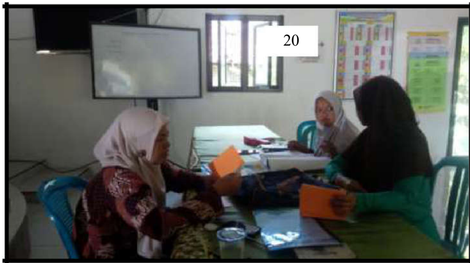
Gambar 16. Kegiatan Persiapan Monev Bank Sampah Alam Subur

Perpustakaan yang selanjutnya di harapkan agar perpustakaan desa Podoroto membina replika perpustakaan desa yang baru di desa – desa lain yang ada di kecamatan Kesamben Jombang