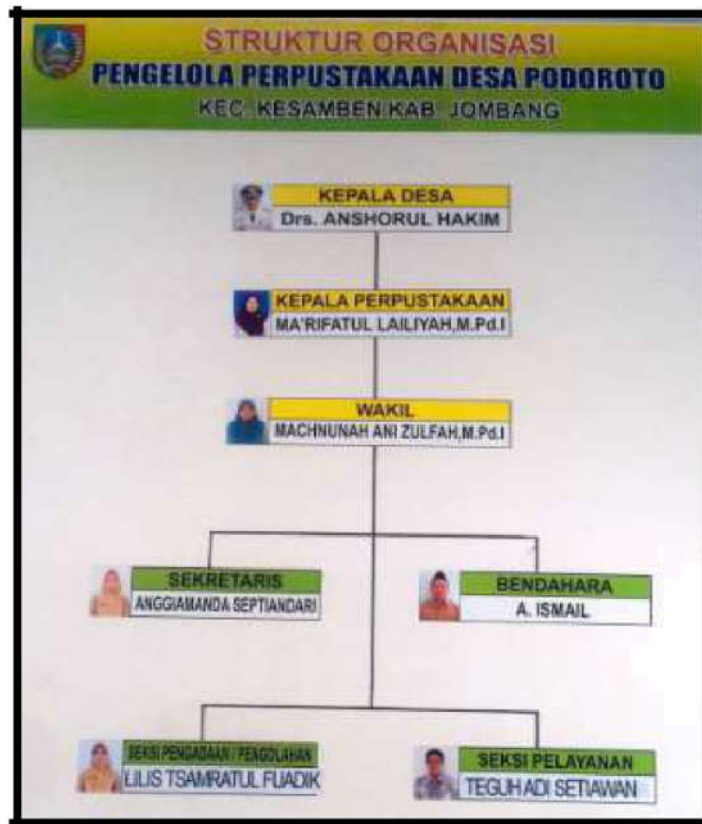
Gambar 2. Struktur Organisasi Pengelola Perpustakaan Desa Podoroto 2018