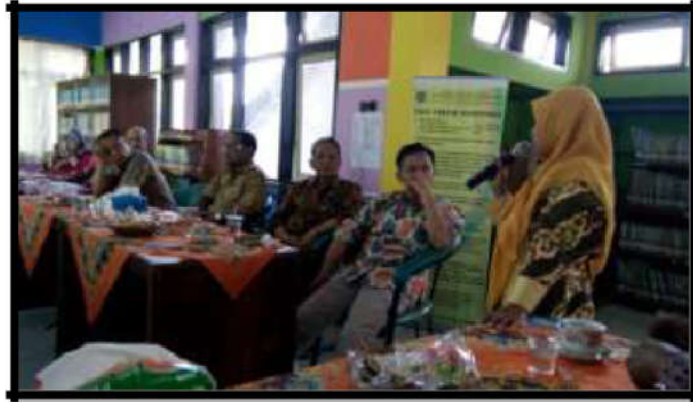
Gambar 12. PLM di Perpusda Kabupaten Jombang