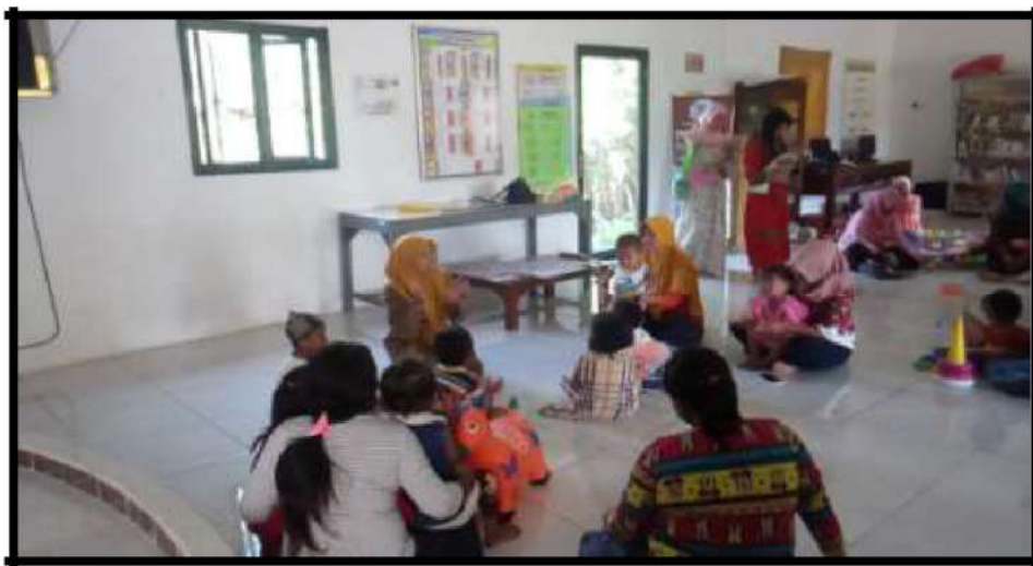
Gambar 18. Kegiatan Taman Posyandu Harapan Bunda

Kegiatan pelibatan masyarakat dalam kegiatan pembuatan ape untuk persiapan kegiatan taman posyandu, dengan harapan dari kegiatan ini proses pembelajaran dan pembinaan dapat berjalan lebih efektif dan efisien.