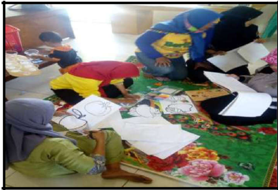
Gambar 17. Kegiatan pembuatan APE

Kegiatan pelibatan masyarakat dalam kegiatan pembuatan ape untuk persiapan kegiatan taman posyandu, dengan harapan dari kegiatan ini proses pembelajaran dan pembinaan dapat berjalan lebih efektif dan efisien.