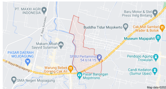
Gambar 1. Peta Wilayah Desa Miagan

Berdasarkan observasi yang telah dilakukan menunjukkan bahwa masyarakat didesa Miagan masih banyak yang belum mengetahui tentang pemanfaatan limbah organik. Sehingga kami berinisiatif mengangkat tema mengenai pemanfaatan eco-enzyme dalam pemberdayaan Masyarakat. Sebagai Upaya untuk memotivasi masyarakat setempat akan cinta lingkungan bersih dan kreatif. Menurut Yusuf dengan meningkatkan aktivitas Masyarakat akan berpotensi meningkatnya volume sampah atau limbah yang akan dihasilkan, karena aktivitas manusia tidak akan terlepas dari adanya sampah atau limbah (Budiyanto et al., 2022). Menurut Megah, sisa kegiatan manusia atau proses alam baik yang berbentuk padat dan zat organik atau anorganik yang tidak diperlukan manusia, menandai keberadaan manusia yang berakibat negatif terhadap lingkungan alam (Budiyanto et al., 2022).