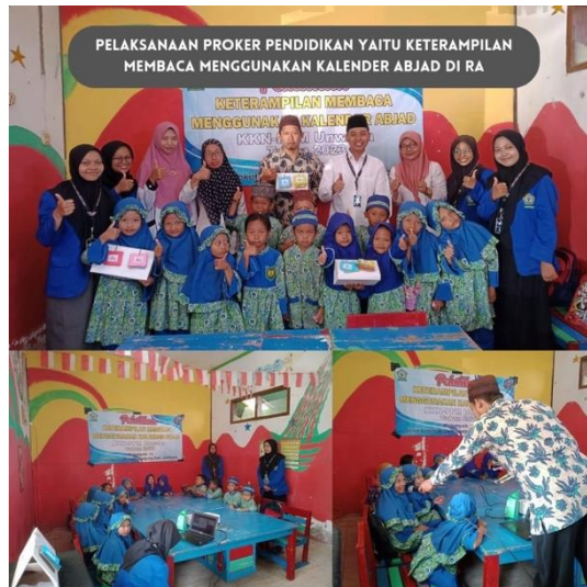
Gambar 4. Pelaksanaan program kerja pendidikan