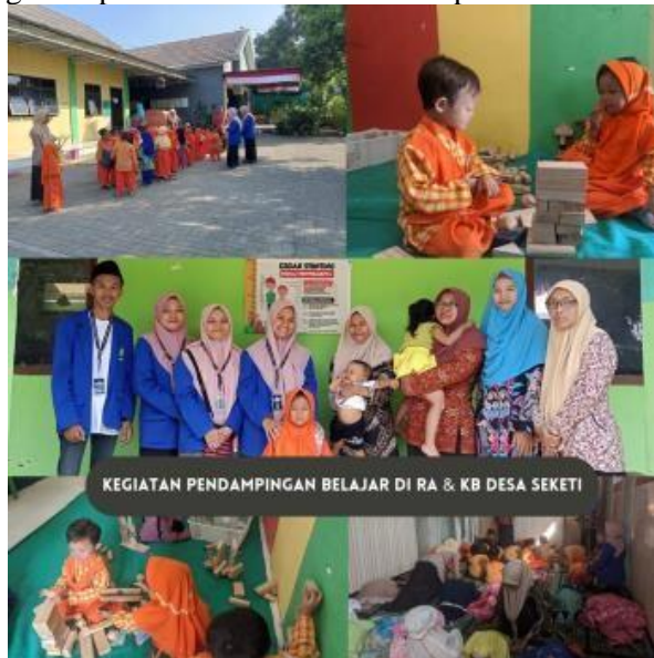
Gambar 2. Koordinasi awal dan observasi lokasi