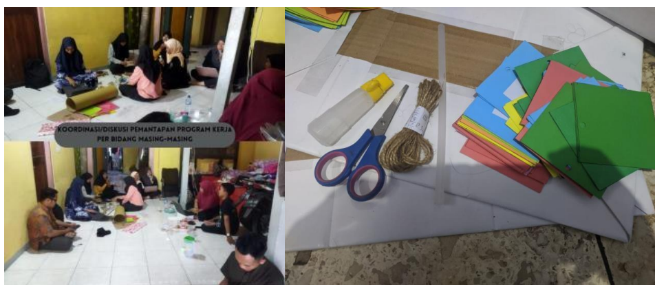
Gambar 3. Koordinasi / Diskusi pemantapan ketersediaan perlengkapan acara