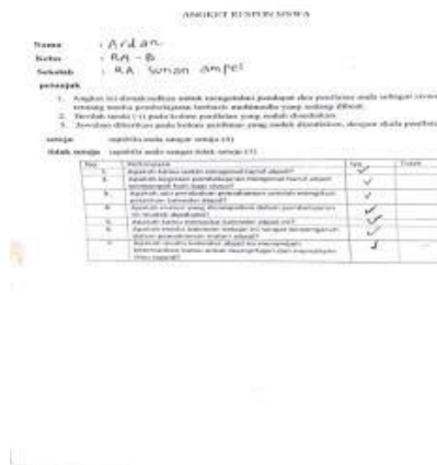
Gambar 5. Angket Respon Siswa

Kegiatan pengabdian ini terdapat produk yang sudah dihasilkan yakni kalender abjad. kalender abjad berisi pengenalan huruf abjad dan penyusunan huruf awal hingga akhir dengan tujuan memudahkan mitra untuk lebih memahami dan lebih mudah dalam proses pembelajaran. Kalender abjad ini merupakan media pembelajaran yang terbuat dari bahan bekas yakni kardus dan kertas. Kalender abjad mirip dengan kalender pada umumnya yang mana dia berbentuk segitiga panjang dikemas pada kertas berwarna untuk menambah nilai keindahan. Adapun dari metode pembelajaran ini dapat meningkatkan sejauh mana pemahaman mitra melalui jawaban dari beberapa pernyataan yang telah diberikan oleh tim Pengabdian.