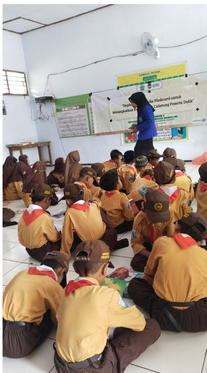
Gambar 3. Pelaksanaan implementasi Flashcard