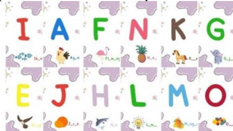
Gambar 1. Contoh Desain Flashcard Calistung (tampak depan)

Berdasarkan hasil rekapitulasi angket yang digunakan, diperoleh persentase sebelum pelaksanaan implementasi adalah 84% dan persentase setelah pelaksanaan implementasi adalah 86% yang dikategorikan baik sekali. Maka dapat diartikan bahwa kegiatan implementasi calistung dengan media flashcard dapat diterima dengan baik oleh pihak mitra atau peserta sasaran pada program kerja tim pengabdian masyarakat ini. Implementasi dan praktik kartu calistung ini memberikan motivasi baru akan keterampilan calistung terhadap peserta didik kelas 1 sampai 3 di MI Miftahul Huda.