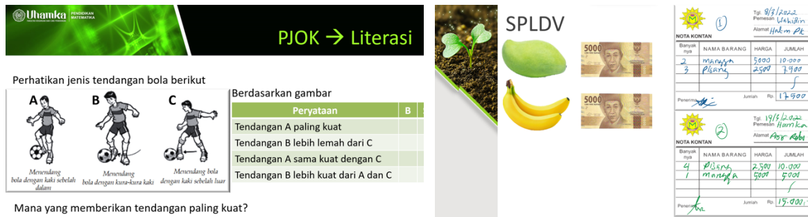
(a) (b) Gambar 3. Soal literasi pada matapelajaran olahraga (a), dan soal literasi matematika/numerasi (b)

Pelatihan ini dilaksanakan selama 3,5 jam yaitu dari pukul 13.00 – 15.30. Waktu pelatihan terbatas, karena memang di SMP Negeri 210 Jakarta pelaksanaan kegiatan masih dilakukan secara terbatas (PPKM). Adapun luaran dari kegiatan pengabdian ini juga ada publikasi pada media massa elektronik yaitu di Kompasiana dengan tautan sebagai berikut: media massa daring Kompasiana dengan link https://www.kompasiana.com/leniuhamka/62e13ceb3555e454ab45fd62/bersama-pendidikan-matematika-uhamka-smpn-210-jakarta-workshop-literasi-dan-numerasi-untuk-kurikulum-merdeka