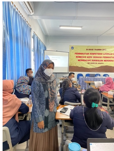
Gambar 2. Diskusi soal literasi dan numerasi dengan guru

Setelah selesai pemaparan, kemudian dilanjutkan dengan diskusi bersama guru-guru tentang pelaksanaan kegiatan literasi dan numerasi yang sudah pernah dilaksanakan di SMP Negeri 210 Jakarta, sebagaimana pada Gambar 2. Peserta sangat antusias terhadap terselenggaranya kegiatan ini. Bahkan hingga waktu pelatihan usai, masih banyak peserta yang ingin berdiskusi.