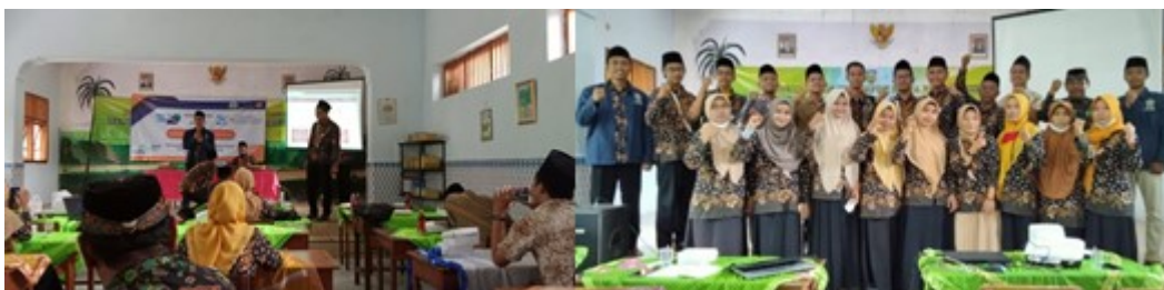
Gambar 3.1. Pengenalan media pembelajaran Quizizz di SDN 1 Sentul

Kegiatan pengabdian kepada masyarakat berupa pengenalan media pembelajaran Quizizz merupakan salah satu upaya peningkatan kualitas pembelajaran di masa pandemi covid 19. Pelaksanaan kegiatan ini didasarkan pada pengamatan lapangan dimana media pembelajaran yang digunakan oleh guru seringkali hanya bersifat satu arah yaitu menggunakan LKS, buku paket yang menjadikan siswa menjadi jenuh terhadap proses pembelajaran karena kurangnya variasi media pembelajaran.