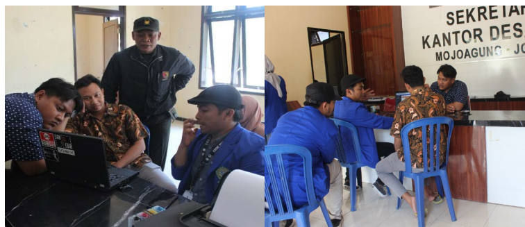
Gambar 2. Pelatihan dan Pendampingan Penggunaan Website Desa