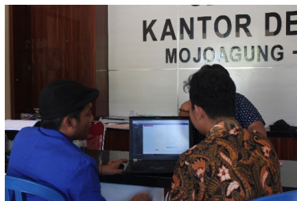
Gambar 1. Sosialisasi Website Desa