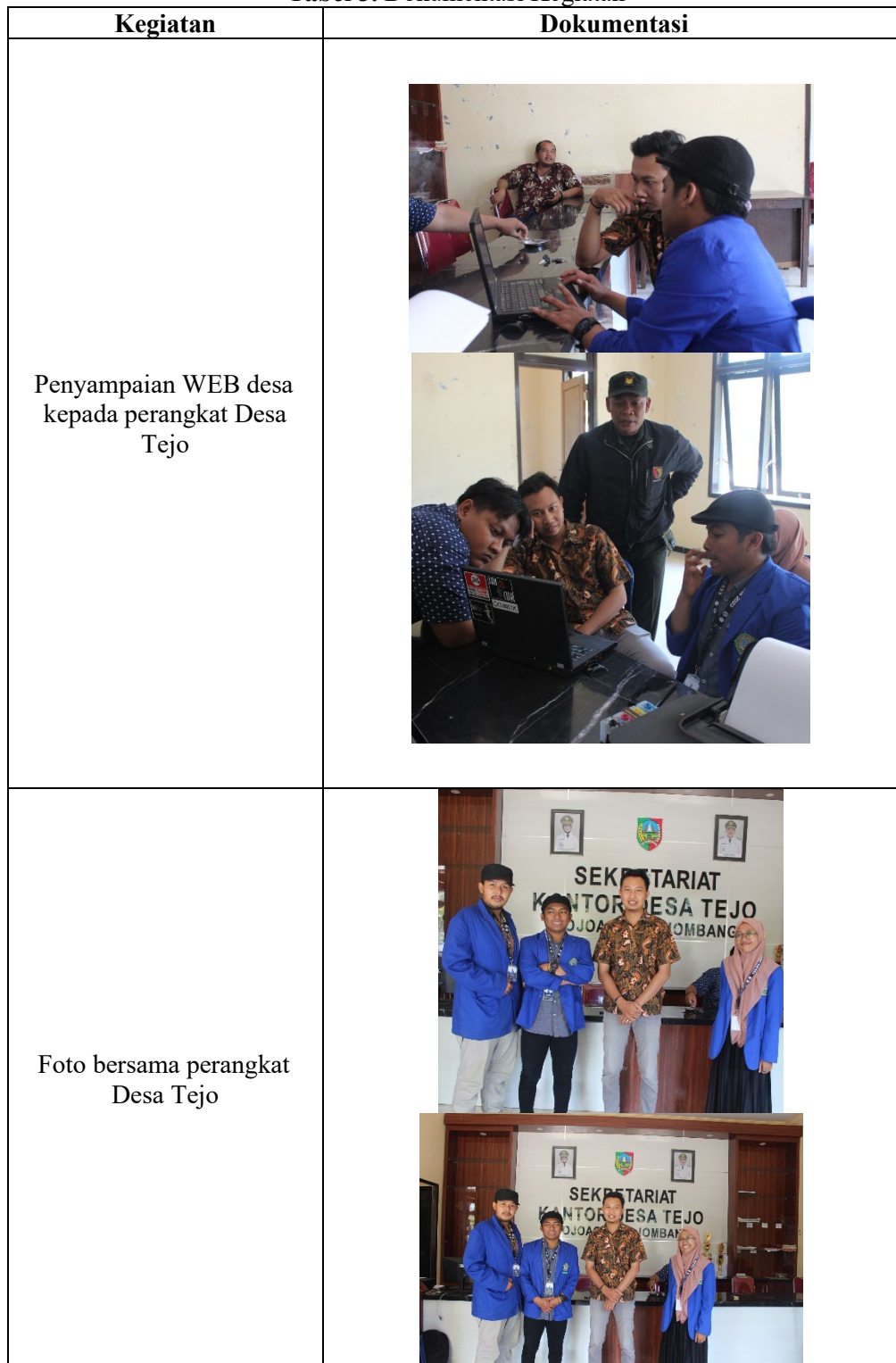
Tabel 3. Dokumentasi Kegiatan