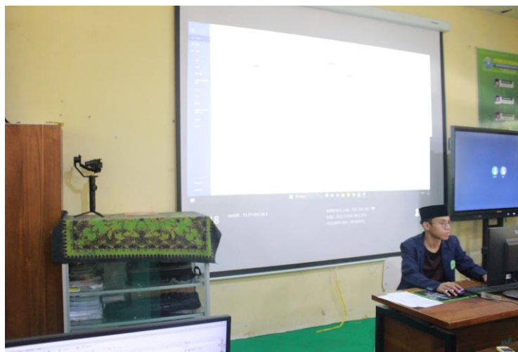
Gambar 2. Persiapan Materi

Kegiatan pelatihan ini dilaksanakan pada tanggal 2 juni 2025 dengan peserta didik sebanyak 29 siswa dalam hal ini karena menyesuaikan dengan jumlah Komputer di lab Komputer SMK Ibrahimy 1 Sukorejo. Kegiatan pelatihan dilakukan dengan durasi waktu 90 menit yakni dimulai dari pukul 13.00 WIB sampai pukul 14.30 WIB. Berikut adalah dokumentasi kegiatan pelatihan yang telah dilaksanakan: