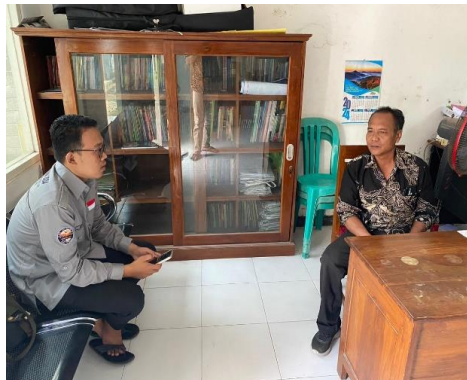
Gambar 1. Observasi

Metode Service Learning adalah pendekatan pendidikan holistik yang bertujuan untuk memungkinkan mahasiswa memahami materi pelajaran dalam konteks kehidupan nyata. Dengan menerapkan metode Service Learning, tercipta hubungan timbal balik yang saling menguntungkan antara mahasiswa dan masyarakat, di mana mahasiswa tidak hanya mendapatkan pengetahuan akademis tetapi juga berkontribusi pada kepentingan dan kebutuhan masyarakat (Kasi et al., 2018).