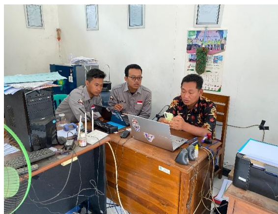
Gambar 3. Uji Kelayakan

Lebih jauh lagi, ada harapan bahwa ada pengembangan lebih lanjut untuk memudahkan masyarakat dalam mengakses informasi desa serta membuat aplikasi yang dapat mempercepat kinerja aparat desa dalam melayani masyarakat.