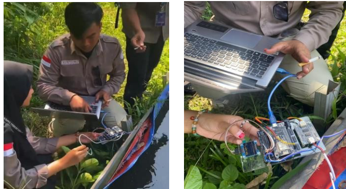
Gambar 3. Pelaksanaan praktikum system monitoring kualitas air dan suhu berbasis IoT