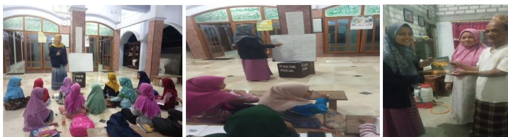
Gambar 1. Foto Kegiatan