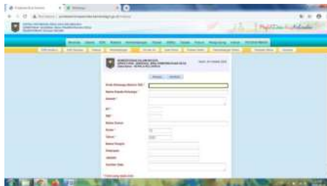
Gambar 5. Menu Tambah KK Baru

Hasil dari peng-Input an data penduduk dapat dilihat pada gambar 1.3, terdapat beberapa menu seperti Tambah KK baru, Kolom, Pengurutan dll. Untuk meng-Input satu data kepala keluarga membutuhkan waktu yang menguras karna terdapat beberapa anggota keluarga yang juga wajib diisi. Untuk menambahkan anggota keluarga baru dapat menge-Klik menu dalam tabel pojok kiri atas. Jika ingin menambahkan KK baru dapat menge-Klik menu KK baru yang terdapat diatas tabel data kepala keluarga, form pengisian kepala keluarga baru dapat dilihat pada Gambar 5.