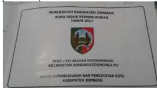
Gambar 3. Buku Induk Kependudukan Tahun 2017 Desa Mojokambang

Dari hasil Observasi diperoleh data yang bersumber dari Buku induk kependudukan tahun 2017, data penduduk yang berada pada buku tersebut lengkap dan dapat digunakan sebagai acuan untuk mengisi data penduduk online melalui website PRODESKEL BINAPEMDES yang merupakan Sistem Informasi Desa dan Kelurahan Direktorat Jenderal Bina Pemerintahan Desa Kementerian Dalam Negeri. Buku Induk Kependudukan tahun 2017 dapat dilihat pada Gambar 3.