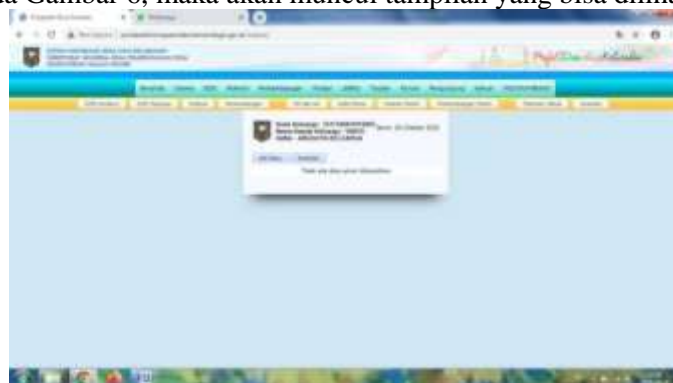
Gambar 6. Tampilan MessageBox Tambah Anggota baru

Menu tambah KK baru berisi form pengisian kepala keluarga yang berupa pengisian data No KK, nama kepala keluarga, alamat, nama dusun, nama pengisi serta sumber data. Setelah data yang telah diisi dalam form pengisian KK baru yang bersumber dari Buku Induk Kependudukan tahun 2017 telah selesai maka bisa menge-Klik tombol Simpan yang berada diatas form pengisian, kemudia tampilan akan kembali pada tampilan data-data pada gambar 1.3. Untuk menambah anggota baru Klik menu dalam tabel pojok kiri atas pada Gambar 6, maka akan muncul tampilan yang bisa dilihat pada Gambar 6.