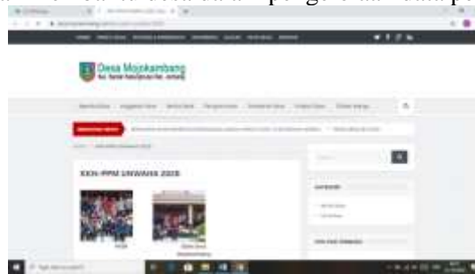
Gambar 1. Website Desa Mojokambang.

Desa Mojokambang merupakan desa yang sebagian masyarakatnya bermata pencaharian sebagai petani, dan merupakan desa yang berada diujung paling selatan dalam Kecamatan Bandarkedungmulyo. Website desa merupakan program dari Kementerian Komunikasi dan Informasi, program ini diluncurkan untuk membantu pemerintah desa dan pemberdayaan masyarakat di desa dalam penggunaan teknologi berbasis internet. Dengan memanfaatkan Teknologi Informasi dan Komunikasi di pedesaan dapat memperbanyak konten positif dan membantu desa dalam pengelolaan data penduduk.