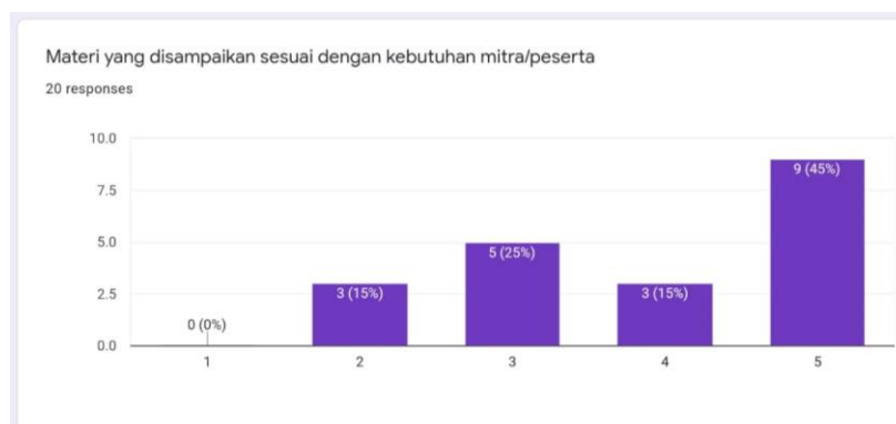
Gambar 1. Hasil Angket Pemahaman Materi

Evaluasi lanjutan yang didapat pelaksana adalah respon kader – kader PKK terhadap pelaksanaan PPTTG. Respon yang didapat berupa bentuk google form kuesioner dengan skala Likert. Yang hasilnya terangkum sebagai berikut.