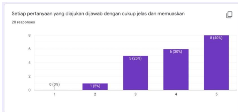
Gambar 3. Hasil Angket Sesi Diskusi