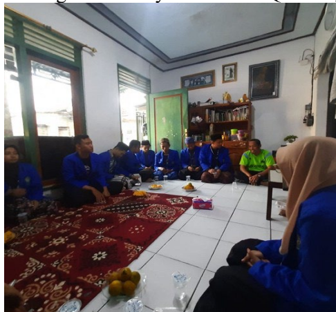
Gambar 1. FGD Persiapan Proker dan Pendampingan kepada Mitra

Awal program kegiatan pengabdian masyarakat pada PPM melalui wawancara kepada kepala TPQ mengenai pemahaman ilmu tajwid dengan metode yanbu'a serta penerapan yang baik dan benar di Desa Balongsari, selanjutnya melakukan koordinasi melalui melakukan izin untuk pelaksanaan pelatihan pemahaman ilmu tajwid dengan metode yanbu'a serta penerapan dengan baik dan benar. Hasil koordinasi dengan pihak mitramengizinkan melakukan kegiatan PPM sesuai dengan jadwal yang sudah ditentukan.