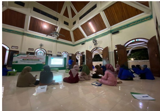
Gambar 3. Pelaksanaan Pelatihan

Penyusunan materi pada kegiatan ini disusun oleh tim pelaksana PPM dalam program keagamaan dengan melakukan pembuatan materi berupa kalender tajwid praktis. Dan produk yang dihasilkan dari PPM ini adalah Kalender tajwid praktis. Kalender tajwid praktis adalah sebuah media pembelajaran yang dibuat untuk memudahkan mitra dalam penerapan pemahaman praktik mengenai ilmu tajwid dengan metode yanbu'a serta penerapan yang baik dan benar. Penyusunan materi pada kegiatan ini disusun oleh rekan-rekan PPM. Tahap penyusunan materi ini dimulai pada awal pelaksanaan dan digunakan untuk kegiatan penerapan pemahaman ilmu tajwid dengan metode Yanbu'a serta penerapan dengan baik dan benar. Desain atau kerangka yang digunakan dalam pengabdian untuk memberikan informasi atau pemetaan Masyarakat ( social mapping ) secara langsung sehingga terjadi interaksi yang cair antara Masyarakat dengan pelaksanaan kegiatan atau dapat diartikan berkolaborasi dengan tim tenaga pendidik untuk melakukan pengembangan media pembelajaran berbasis kalender fisik.