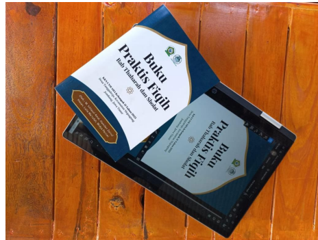
Gambar 2. Luaran Hasil Pengabdian berupa Buku

Produk yang dihasilkan dari PPM ini adalah Buku Fiqih Praktis. Buku Fiqih Praktis adalah sebuah modul pembelajaran yang dibuat untuk memudahkan mitra dalam penerapan pemahaman praktik mengenai Ilmu Fiqih dengan baik dan benar