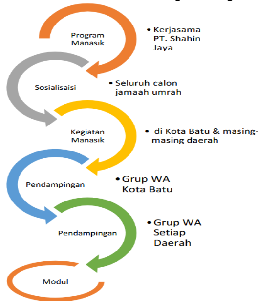
Pelaksanaan Program EduManarah Kota Batu

Adapun tahap pelaksanaan Edukasi Manasik Umrah pada penyelenggara Umrah di Kota Batu dilaksanakan setelah adanya proses pengambilan data secara teknik RRA. Paktiknya menggunakan pendekatan PRA yaitu mengadakan sosialisasi umum pada seluruh calon jamaah umrah yang waktunya disesuaikan dengan pelaksanaan manasik sesuai dengan jadwal pada biro penyelenggara. Peningkatan pemahaman calon jamaah umrah. Dilaksanakan sebagaimana gambar berikut: