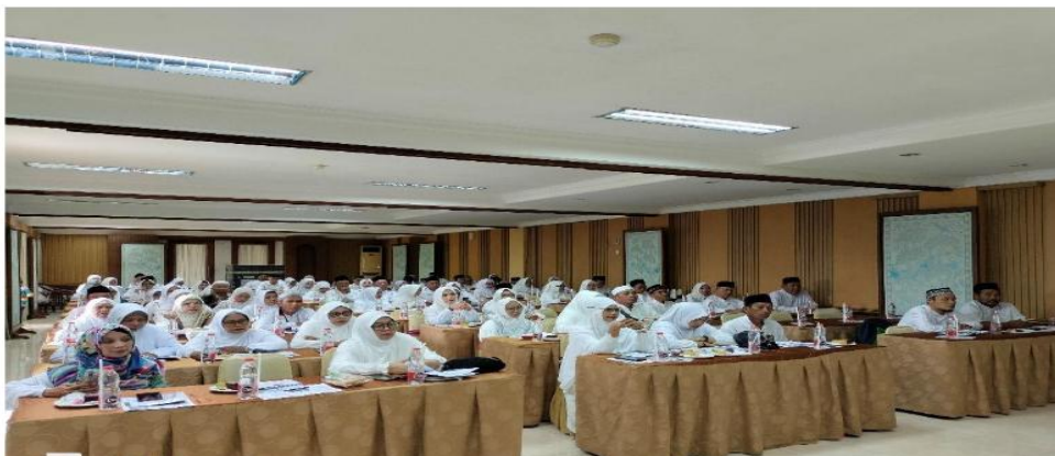
Gambar 3.3. Calon Jamaah Umrah Menyimak Paparan Narasumber

Edukasi manasik umrah ( EduManarah ) untuk calon jamaah umrah dilaksanakan dengan memberikan serangkaian ketrampilan teoritis dan praktis. EduManarah ini penting karena ketidak-tahuan pengetahuan dan informasi tentang umrah akan menjadi keterasingan nilai-nilai Islami. Keterasingan dari nilai-nilai spiritual ini tentunya dapat menyebabkan penurunan kualitas keimanan dan ketaqwaan, yang sangat diperlukan dalam melaksanakan ibadah umrah secara khusyuk dan penuh rasa syukur. (Kurniawan, B., 2023).