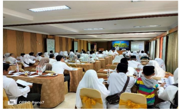
Gambar 1.2. Pelaksanaan EduManarah