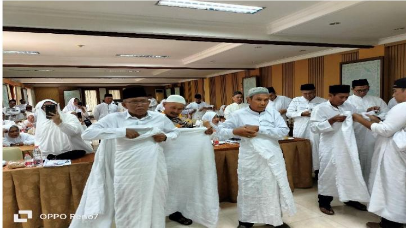
Gambar 3.4. Sesi Praktik Mengenakan Kain Ihram untuk Berihram

Antusias calon jamaah umrah sangat terlihat saat praktik mengenakan kain ihram. Suasana khidmat dan mengharukan juga terlihat dari setiap jamaah saat mengikuti sesi praktik mengenakan kain ihram. Hal yang serupa juga terlihat begitu Khidmah saat seluruh jamaah melaksanakan praktik thawaf sebagaimana yang terlihat pada gambar berikut.