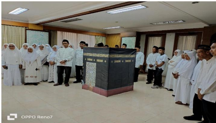
Gambar 3.5. Praktik Thawaf

Antusias calon jamaah umrah sangat terlihat saat praktik mengenakan kain ihram. Suasana khidmat dan mengharukan juga terlihat dari setiap jamaah saat mengikuti sesi praktik mengenakan kain ihram. Hal yang serupa juga terlihat begitu Khidmah saat seluruh jamaah melaksanakan praktik thawaf sebagaimana yang terlihat pada gambar berikut.