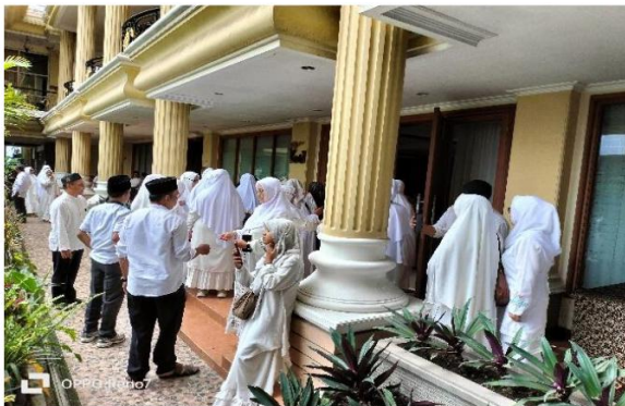
Gambar 1.1. Persiapan EduManarah

Melalui sinergi antara metode tatap muka dan virtual, berbasis nilai spiritual dan inklusivitas, diharapkan program ini dapat memfasilitasi masyarakat Kota Batu dalam menggali makna spiritual ibadah umrah, membangun kualitas keimanan, serta memperkuat taqarrub kepada Allah Swt. dengan semangat baru.