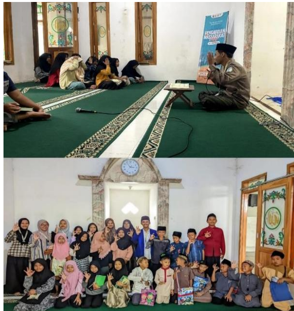
Gambar 2. Dokumentasi pelatihan Qir'oah

Hasil pelatihan menunjukkan adanya peningkatan pengetahuan peserta mengenai variasi nada dalam Qira'ah. Sebelum pelatihan, mayoritas peserta membaca Al-Qur'an dengan nada datar, namun setelah mengikuti pelatihan, mereka mulai mengenal tujuh nada dasar. Perubahan ini sejalan dengan penelitian Fernando (2020) yang menekankan pentingnya latihan terstruktur dalam memperkenalkan variasi irama agar bacaan Al-Qur'an lebih hidup dan bernuansa indah.