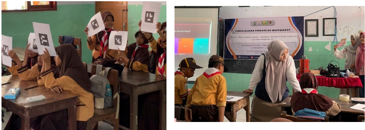
Gambar 4 : Demonstrasi quizziz untuk persiapan tahapan evaluasi