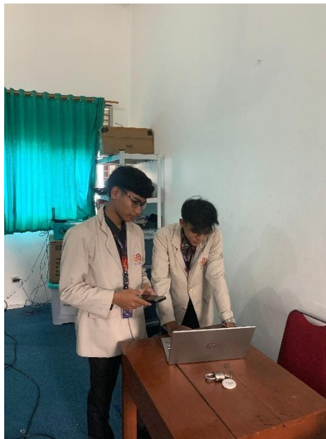
Gambar 2. Persiapan Pematerian

Kegiatan pelatihan diawali dengan persiapan materi dan perangkat simulasi, dilanjutkan dengan penyampaian pengantar konsep jaringan dan komunikasi data. Setelah itu, peserta mengikuti praktik langsung menggunakan Cisco Packet Tracer, yang meliputi perancangan topologi jaringan sederhana, pengalamatan IP, konfigurasi perangkat jaringan, serta pengujian konektivitas.