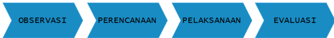
Gambar 1. Tahapan Pelaksanaan

Metode pelaksanaan mengikuti pola umum pelatihan berbasis simulasi dan praktik di pendidikan vokasi, yang meliputi tahap observasi, perencanaan, pelaksanaan, dan evaluasi (Duchatelet et al., 2022; Mwansa et al., 2024; Ningrum et al., 2020; Offiah et al., 2019). Tahap observasi awal dilakukan melalui survei lapangan dan koordinasi dengan pimpinan SMK Negeri 01 Banyumas untuk memperoleh perizinan, menyepakati jadwal pelaksanaan, serta mengidentifikasi kebutuhan pembelajaran dan kesiapan fasilitas pelatihan berbasis simulasi di pendidikan vokasi (Duchatelet et al., 2022; Messina Dahlberg & Gustavsson, 2025; Mwansa et al., 2024; Nyström & Ahn, 2024).