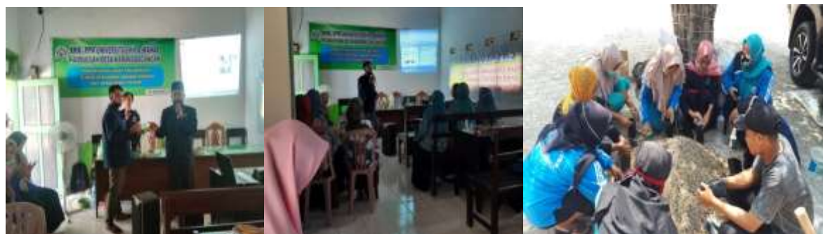
Gambar 3.1. Foto kegiatan

Pelaksanaan kegiatan pengabdian kepada masyarakat berbasis pertanian dilakukan sesuai dengan rencana dan kesepakatan yang telah dilakukan. Kegiatan dilaksanakan oleh Tim PKM beserta mahasiswa yang sudah ditunjuk untuk mendampingi peserta pelatihan dan membantu kelancaran program. Pelaksanaan program ini menggunakan metode ceramah, diskusi, pelatihan, dan pendampingan. Kegiatan ini diikuti sebanyak 16 peserta dari perwakilan kader PKK dengan bertempat di Balai Desa Karangdagangan. Narasumber dalam kegiatan ini adalah salah satu mahasiswa di Fakultas Pertanian KH. A. Wahab Hasbullah.