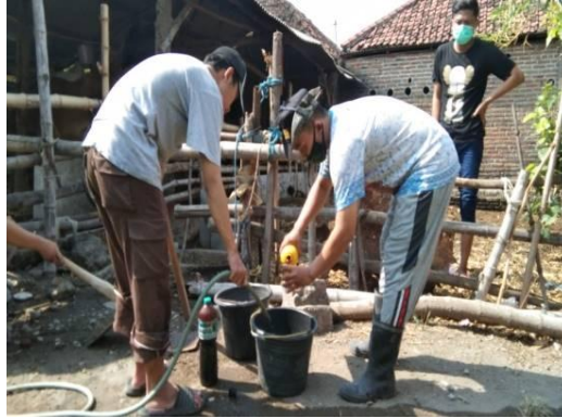
Gambar 2. Tahap Perancangan Pupuk Organik Limbah Ternak

Pada kegiatan pelatihan, peneliti melakukan observasi aktivitas peserta pelatihan (Gambar 3). Pada tahap ini, dilakukan penilaian keterampilan peserta dalam membuat pupuk organik limbah ternak. Ada 3 (tiga) komponen yang dinilai meliputi kemampuan memahami petunjuk pembuatan pupuk organik, kemampuan membuat pupuk organik, dan kemampuan menerapkan pupuk organik. Data hasil observasi disajikan pada Gambar 4. Pada aspek kemampuan memahami petunjuk pembuatan pupuk organik memperoleh nilai rata-rata 3,7 atau 39% dimana peserta pelatihan mampu memahami isi petunjuk atau prosedur yang ada dengan baik. Hal ini menjadi kunci dalam melakukan perancangan pupuk organik di tahapan selanjutnya. Pada aspek kemampuan membuat pupuk organik dengan nilai rata-rata 3,1 atau 28% dimana pada aspek ini peserta pelatihan melakukan pembuatan pupuk organik limbah ternak. Namun pada aspek ini beberapa peserta pelatihan mengalami kesulitan dalam membuat pupuk organik dengan beberapa faktor yang mempengaruhi yaitu beberapa peserta kurang aktif dalam membuat pupuk organik tersebut dan belum memahami prosedur dengan benar. Pada aspek kemampuan menerapkan pupuk organik diperoleh nilai rata-rata 3,5 atau 33% dimana peserta pelatihan menerapkan pupuk organik di sawah atau untuk tanaman.