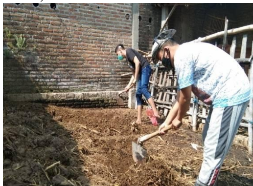
Gambar 1. Tahap Persiapan Pupuk Organik Limbah Ternak

Tahap persiapan dilakukan dengan memperkenalkan beberapa alat dan bahan pupuk organik. Alat dan bahan yang diada yaitu limbah ternak, ember, air, EM4, Molase (tetes tebu), dan lain-lain. Melalui tahap persiapan ini peserta workshop mendapatkan pengetahuan dan pengalaman langsung terkait persiapan pembuatan pupuk organik (Gambar 1).