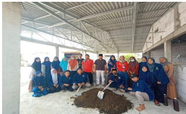
Gambar 3. Peserta Pelatihan Pembuatan Pupuk Organik

Pada kegiatan pelatihan, peneliti melakukan observasi aktivitas peserta pelatihan (Gambar 3). Pada tahap ini, dilakukan penilaian keterampilan peserta dalam membuat pupuk organik limbah ternak. Ada 3 (tiga) komponen yang dinilai meliputi kemampuan memahami petunjuk pembuatan pupuk organik, kemampuan membuat pupuk organik, dan kemampuan menerapkan pupuk organik. Data hasil observasi disajikan pada Gambar 4. Pada aspek kemampuan memahami petunjuk pembuatan pupuk organik memperoleh nilai rata-rata 3,7 atau 39% dimana peserta pelatihan mampu memahami isi petunjuk atau prosedur yang ada dengan baik. Hal ini menjadi kunci dalam melakukan perancangan pupuk organik di tahapan selanjutnya. Pada aspek kemampuan membuat pupuk organik dengan nilai rata-rata 3,1 atau 28% dimana pada aspek ini peserta pelatihan melakukan pembuatan pupuk organik limbah ternak. Namun pada aspek ini beberapa peserta pelatihan mengalami kesulitan dalam membuat pupuk organik dengan beberapa faktor yang mempengaruhi yaitu beberapa peserta kurang aktif dalam membuat pupuk organik tersebut dan belum memahami prosedur dengan benar. Pada aspek kemampuan menerapkan pupuk organik diperoleh nilai rata-rata 3,5 atau 33% dimana peserta pelatihan menerapkan pupuk organik di sawah atau untuk tanaman.