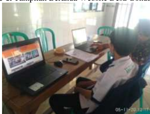
Gambar 2. Pelatihan dan Pendampingan Pengoperasian dan Pengelolaan Website